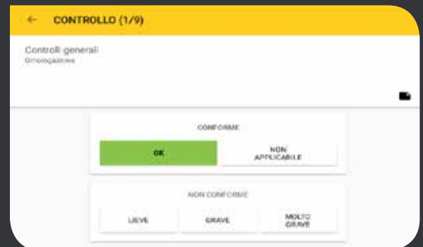
Verifica sicurezza tramite tablet